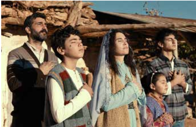
Al-Shafaq – Wenn der Himmel sich spaltet