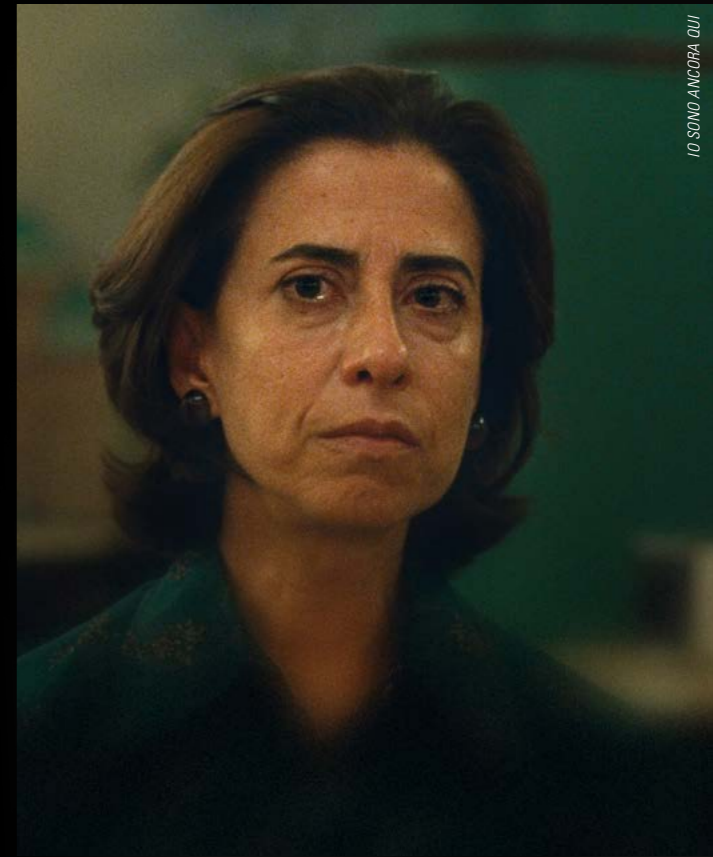
IO SONO ANCORA QUI